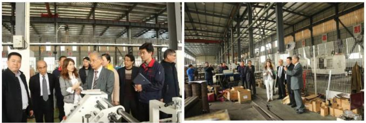
インターネットで公開された工場なので掲載。