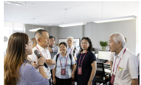
会長と技術面での対談風景