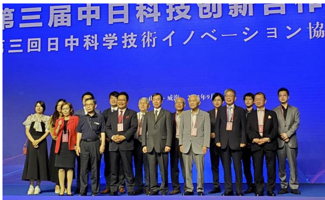
日本から参加した人達