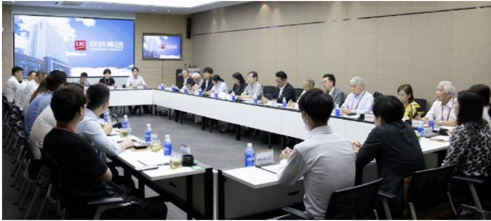
会長と専門家訪問時の会見風景