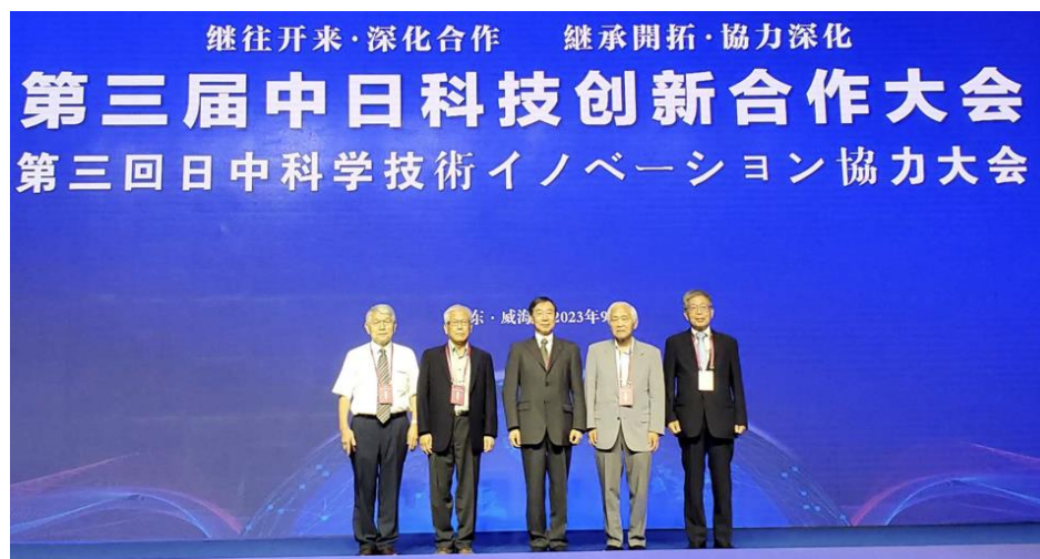
参加した技術士達