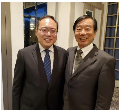
市長とのスナップ