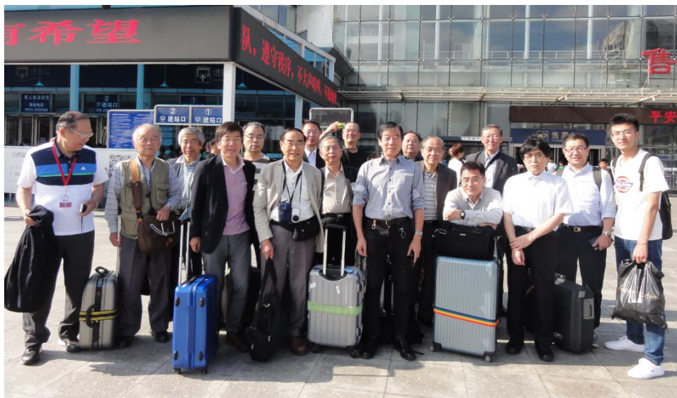
淄博駅で帰路に向かう参加者の皆さん